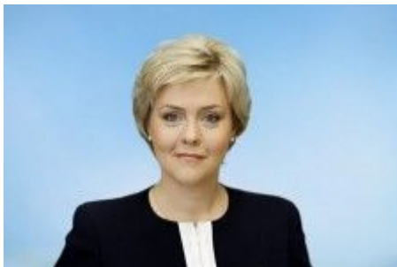
Eesti Vabariigi sotsiaalminister Maret Maripuu

Puuetega inimeste toimetuleku, toetuste ja töötamise võimalustega tegeleb kõige rohkem Eesti Vabariigi Sotsiaalministeerium