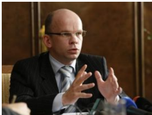
Õiguskantsler Allar Jõks

Kõikidel inimestel on õigus pöörduda kaebusega õiguskantsleri poole.