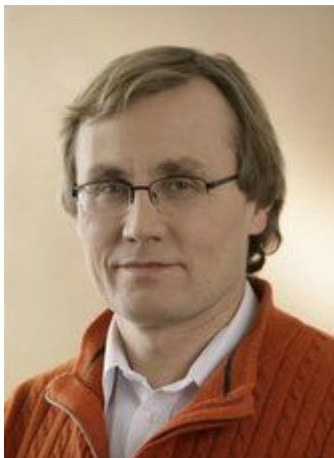
Eesti Vabariigi haridusminister Tõnis Lukas

Erivajadustega inimeste hariduse saamise küsimustega tegeleb Eesti Vabariigi Haridusministeerium