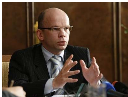
Õiguskantsler Allar Jõks

Kõikidel inimestel on õigus pöörduda kaebusega õiguskantsleri poole.