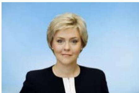
Eesti Vabariigi sotsiaalminister Maret Maripuu

Puuetega inimeste toimetuleku, toetuste ja töötamise võimalustega tegeleb kõige rohkem Eesti Vabariigi Sotsiaalministeerium