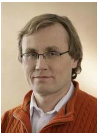
Eesti Vabariigi haridusminister Tõnis Lukas

Erivajadustega inimeste hariduse saamise küsimustega tegeleb Eesti Vabariigi Haridusministeerium